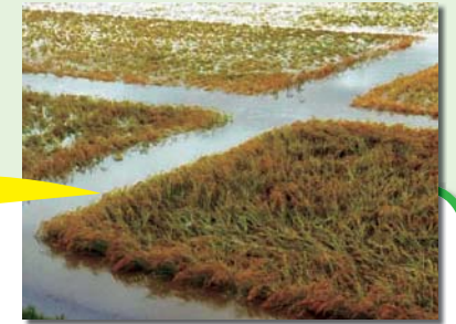
稲の浸水は農家にとって死活問題

回答 重点管理区間というのを定めて優先順位をつけ、支障木伐採・堆積土砂の撤去を実施してまいりました。ご指摘のありました迫川で、今回の豪雨により上流の二迫川合流付近において越水し、家屋等に浸水被害が発生しました。それを踏まえて、今回の補正予算で災害対策等緊急事業推進費を計上し、若柳大橋上流部の河道掘削と支障木伐採を行います。引き続き、そういった取り組みを続けてまいります。