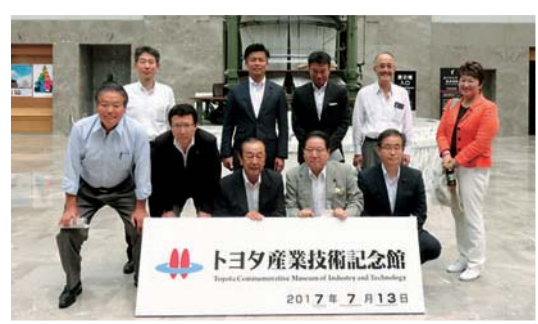
トヨタ産業技術記念館訪問