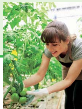
体験型観光など個性が大切

回答 滞在型旅行であるグリーンツーリズムや農泊は、地域の所得向上や活性化につながります。連携した取り組みの支援と、DMO設立に向けたアドバイスを行うなど、地域の特性を生かした訪日外国人観光客などにとって魅力ある観光地域づくりを進められるように支援して参ります。