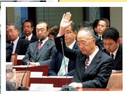
予算特別委員会にて