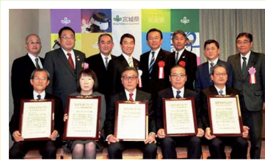
富県みやぎグランプリ (受賞者の皆様と)