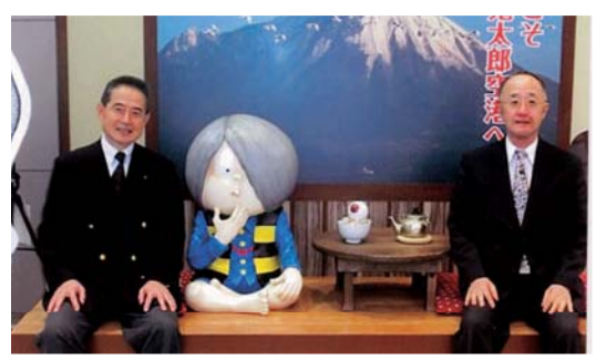
米子鬼太郎空港にて