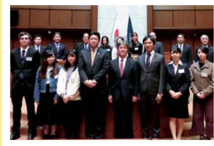
若者と意見交換会