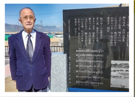
令和5年3月11日 大川小学校