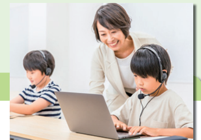
教育現場における情報管理システムの必要性は既に世界の標準となっており、更なる充実が求められる。