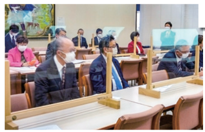
災害公営住宅入居者の健康状態報告会