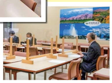
食物アレルギー等の勉強会