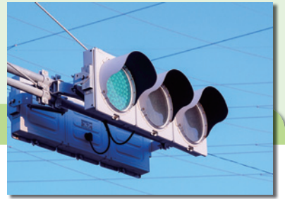
LED 信号は電球式と比べ太陽の反射などによる誤認が少なく，消費電力も6分の1であるため普及に力を尽くしたい。

主な事業は信号灯器のLED化などの交通信号機の改良工事，あるいはパーキング・メーターの更新工事などがございます。箇所数につきましては，交通信号機の信号LED化などについては167か所，それからパーキング・メーターの更新については，仙台市内などで11か所などとなっているところでございます。