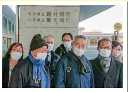
岩手県立磐井病院・南光病院視察