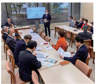
福島原発勉強会 「アルプス水の放流について」