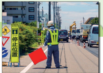
予算の問題とともに，交通の負担にならない諸々の条件を鑑みながら，早めの工事の計画を。

LED化については，LED化とともに信号柱の更新工事などもございます。道路改良工事との調整とか，あるいは材料となる資材の調達に期間を要するというところで，繰越明許費に計上しているところでございます。なお，この繰越明許費に計上している事業は，工事が完了しないものもございませけれども，見込みのものもございませますが完了しないおそれのある事業も併せて計上しているもので，このように膨れているということでございます。