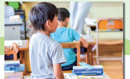
教育事務所費については、地域の人材育成の見地から損得のみで割り切れない部分があり、今後も調査が必要。