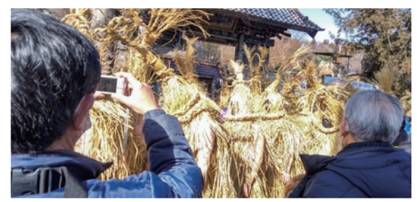
令和5年2月5日 米川の水かぶり(ユネスコ無形文化遺産)